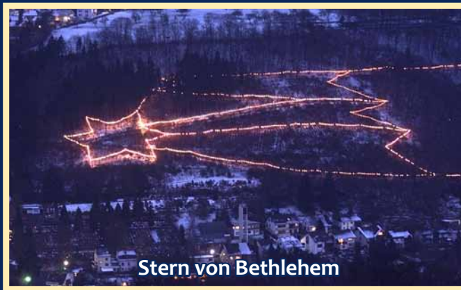
Stern von Bethlehem