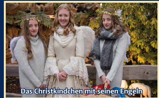
Das Christkindchen mit seinen Engeln

Am 2. Advent-Wochenende (7.-8.12.2019) gibt es im Kolpinghaus den wetterunabhängigen „Selberrmacher-Weihnachtsbasar“ mit Anbietern aus der Region.